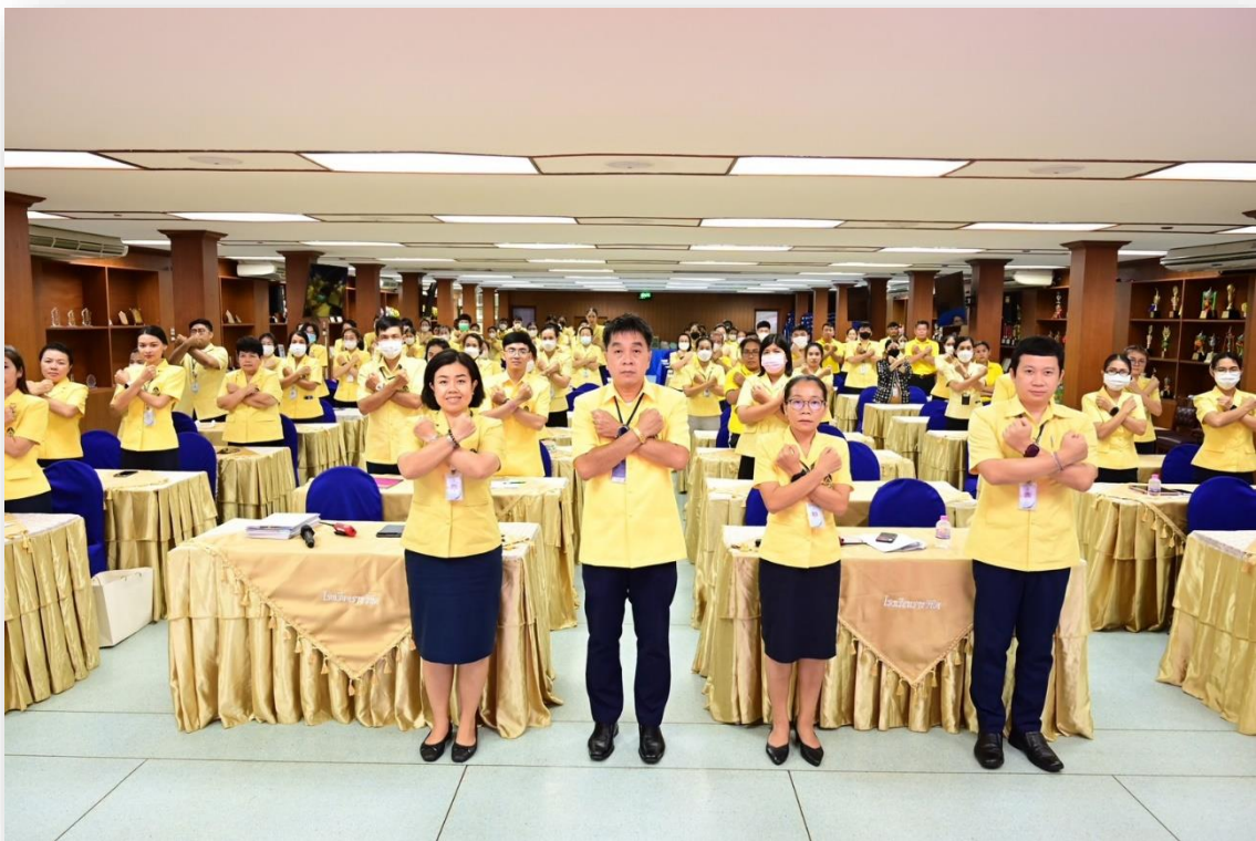
ผู้อำนวยการโรงเรียน ฝ่ายบริหารและคณะครู บุคลากรทางการศึกษา โรงเรียนราชวินิต แสดงสัญลักษณ์ในการประกาศเจตนารมณ์ต่อต้านการทุจริตทุกรูปแบบ