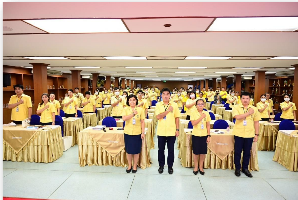
ผู้อำนวยการโรงเรียน ฝ่ายบริหารและคณะครู บุคลากรทางการศึกษา โรงเรียนราชวินิต แสดงสัญลักษณ์ในการประกาศเจตนารมณ์ต่อต้านการทุจริตทุกรูปแบบ