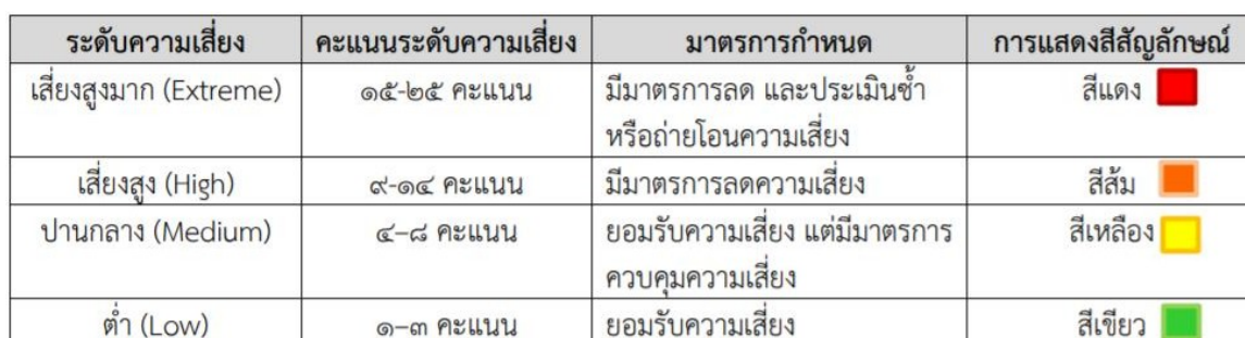
ตารางระดับของความเสี่ยง (Degree of Risk)

ซึ่งจัดแบ่งเป็น ๔ ระดับ สามารถแสดงเป็น Risk Profile แบ่งพื้นที่เป็น ๔ ส่วน (๔ Quadrant) ใช้เกณฑ์ในการจัดแบ่ง ดังนี้