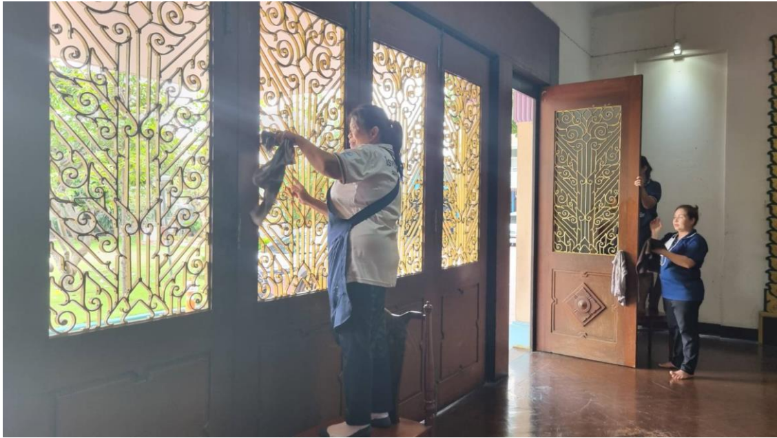
นักพัฒนาได้ทำความสะอาด และปรับภูมิทัศน์ภายในโรงเรียนเพื่อเตรียมความพร้อมสำหรับการจัดการเรียนการสอน