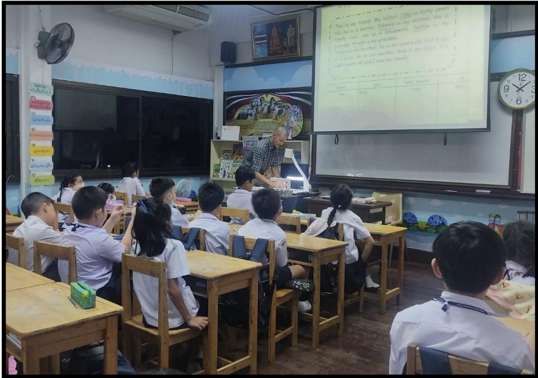
ครูต่างชาติจัดการเรียนการสอนให้กับนักเรียน