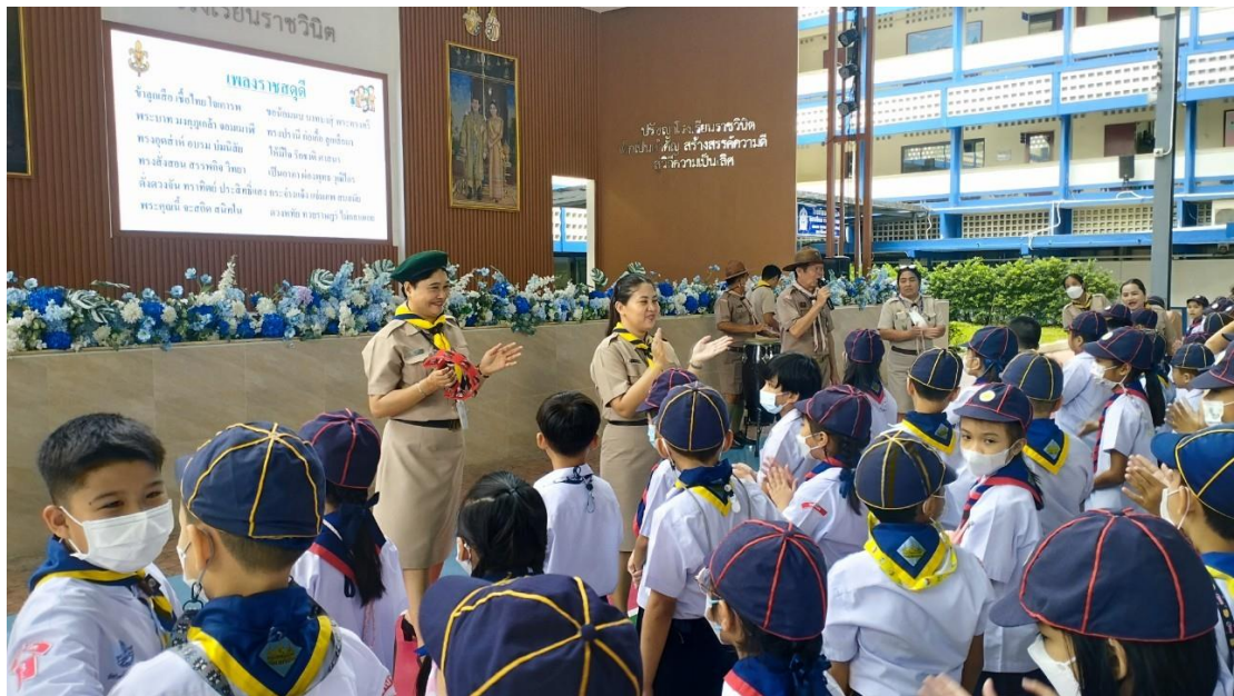
ผู้กำกับลูกเสือจัดกิจกรรมลูกเสือสำรอง