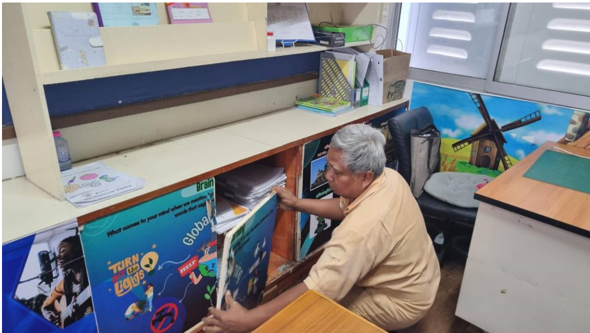
นักพัฒนาได้ทำความสะอาด และปรับภูมิทัศน์ภายในโรงเรียนเพื่อเตรียมความพร้อมสำหรับการจัดการเรียนการสอน