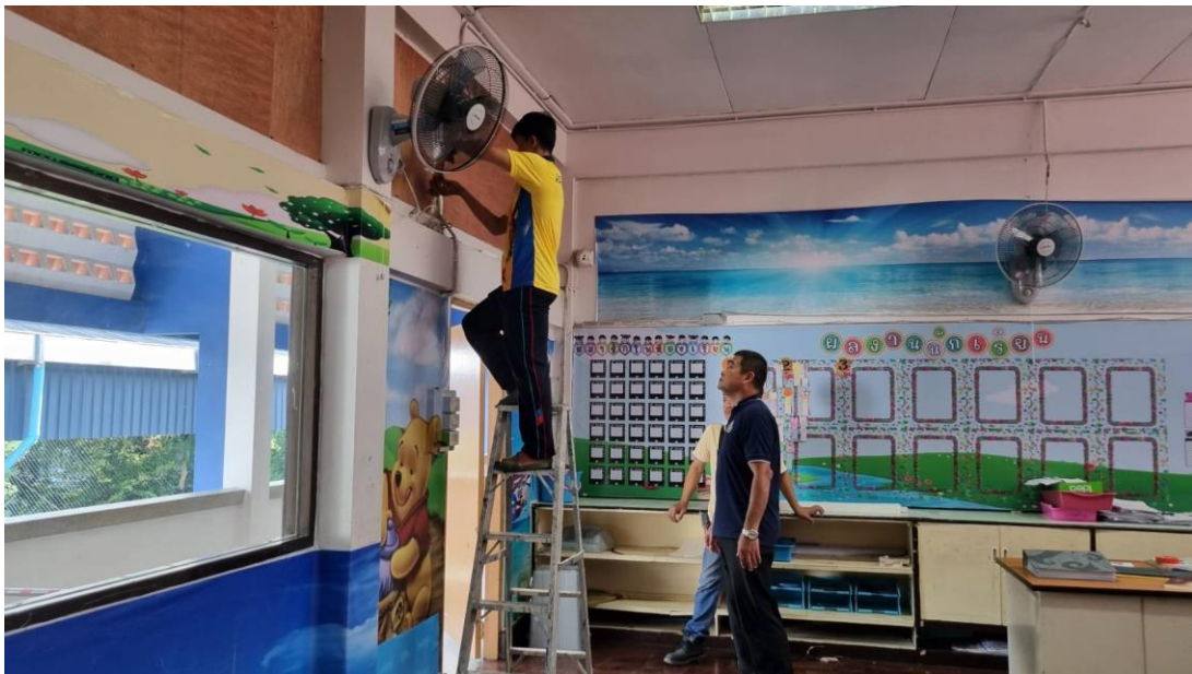
นักพัฒนาได้ทำความสะอาด และปรับภูมิทัศน์ภายในโรงเรียนเพื่อเตรียมความพร้อมสำหรับการจัดการเรียนการสอน