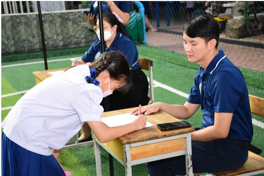
ปฏิบัติหน้าที่ตามคำสั่งของโรงเรียน