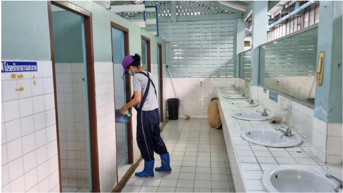
นักพัฒนาได้ทำความสะอาด และปรับปรุงทัศนียภาพในโรงเรียนเพื่อเตรียมความพร้อมสำหรับการจัดการเรียนการสอน