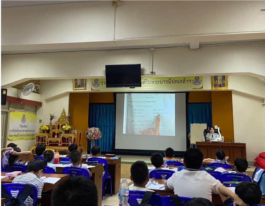
ครูที่มีความเชี่ยวชาญด้านภาษาอังกฤษ ตีวิชาภาษาอังกฤษให้กับนักเรียนที่ได้รับคัดเลือกโครงการช้างเผือก ณ ห้องประชุมแสงเทียน