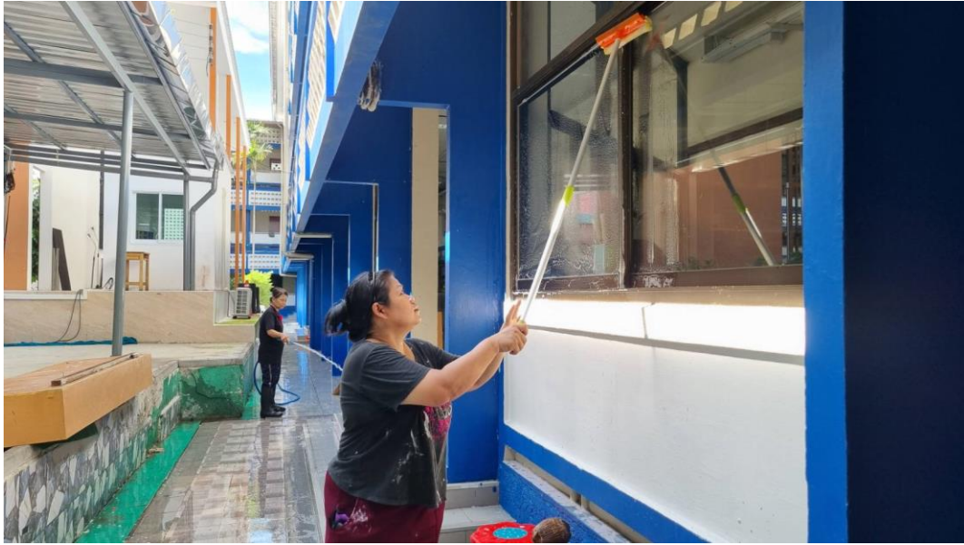
นักพัฒนาได้ทำความสะอาด และปรับภูมิทัศน์ภายในโรงเรียนเพื่อเตรียมความพร้อมสำหรับการจัดการเรียนการสอน