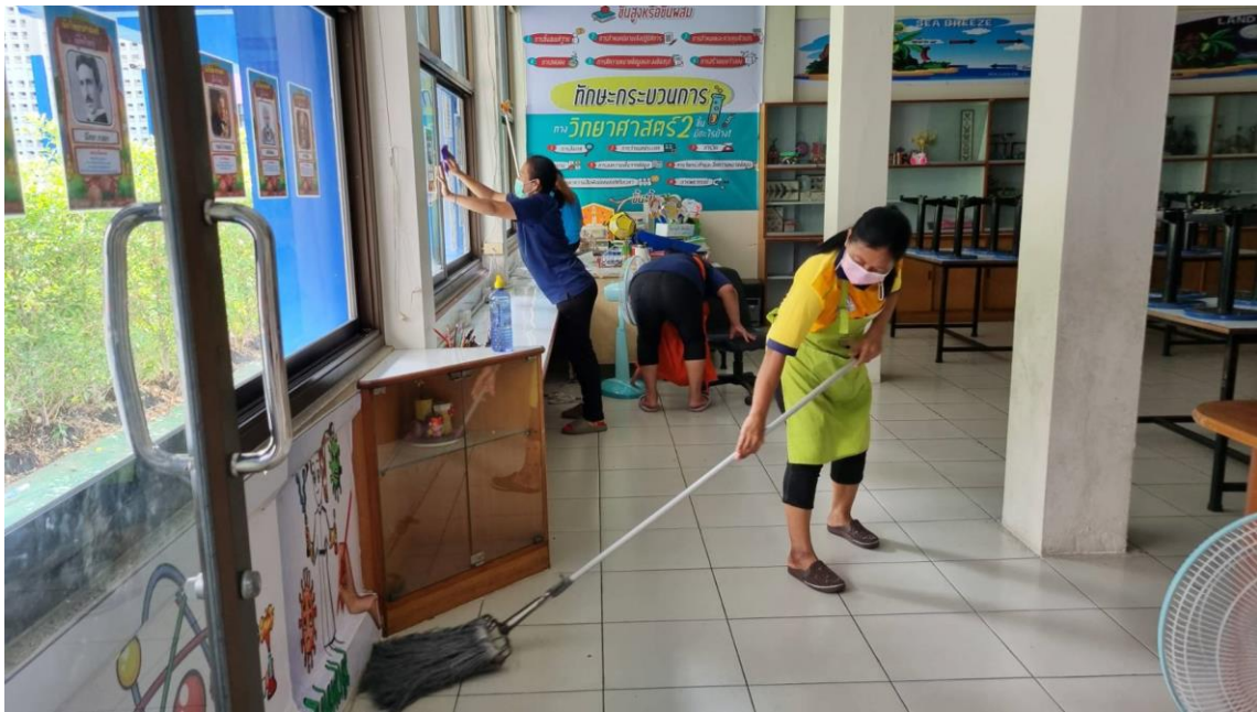
นักพัฒนาได้ทำความสะอาด และปรับปรุงทัศนียภาพในโรงเรียนเพื่อเตรียมความพร้อมสำหรับการจัดการเรียนการสอน