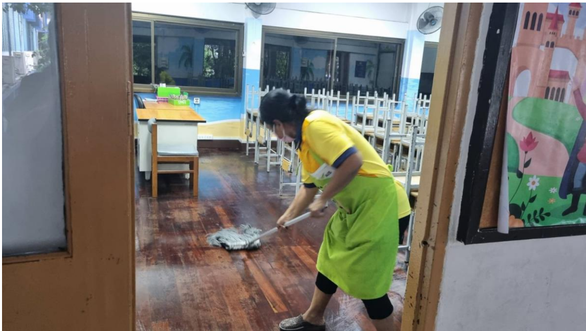
นักพัฒนาได้ทำความสะอาด และปรับภูมิทัศน์ภายในโรงเรียนเพื่อเตรียมความพร้อมสำหรับการจัดการเรียนการสอน