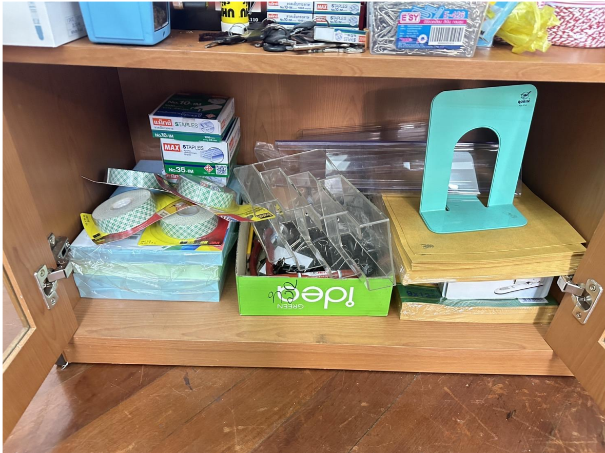
วัสดุอุปกรณ์ ในโครงการจัดซื้อวัสดุสำนักงานกลุ่มบริหารงานบุคคล