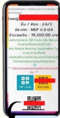
สแกนผ่าน QR-Code