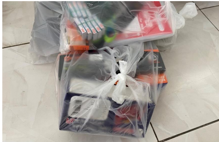
วัสดุฝึกสอนสอบ