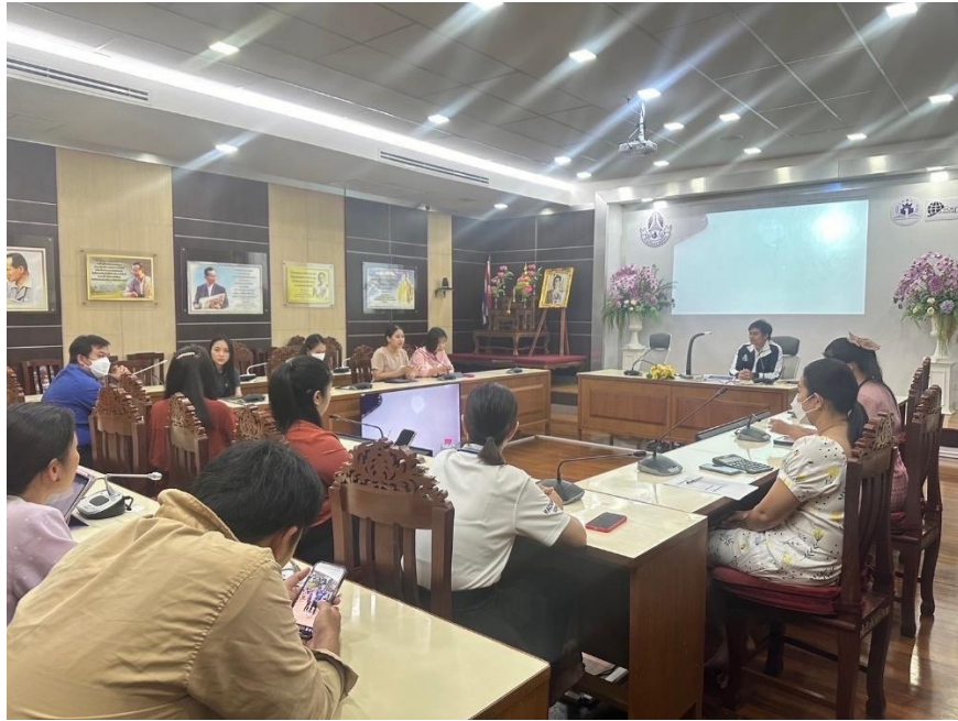
การประชุมการดำเนินการจัดทำรายงานผลการประเมินตนเองของสถานศึกษา (SAR)