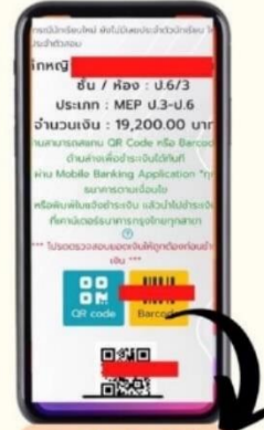
สแกนผ่าน Bar-Code