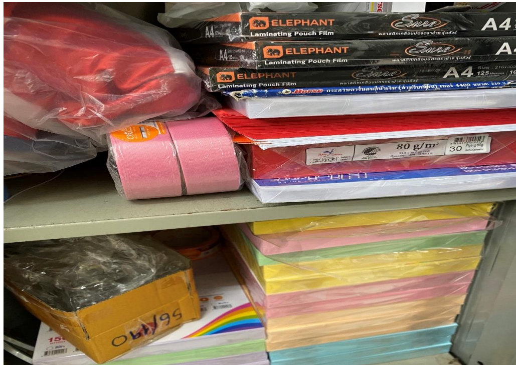
วัสดุสำนักงานกลุ่มบริหารแผนงานและงบประมาณ